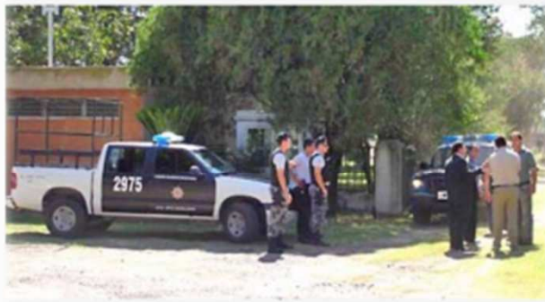
Personal de seguridad y agentes de Justicia se hicieron presentes en el lugar. La víctima fatal murió en el acto.

Rafaela.— Un muerto y un herido de gravedad fue el lamentable saldo que produjo una fuerte explosión producida, pasadas las 9.30 de la mañana de ayer, en la fábrica de explosivos Foti Manufactura Argentina de Pólvora SA (Fomapsa), ubicada en el sector norte de la ciudad. La tragedia se produjo a cuatro años de un accidente de similares características que dejaron un saldo de cuatro muertos (ver aparte)