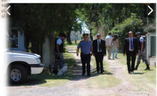
Se desplegó la fuerza policial y judicial en la zona de la trágica.